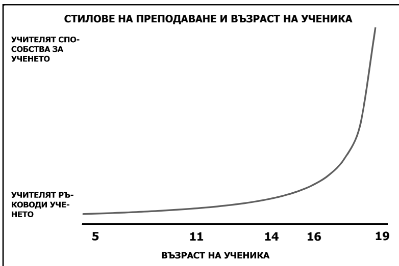
Фигура 1. Стиллове на преподаване и възраст на ученика